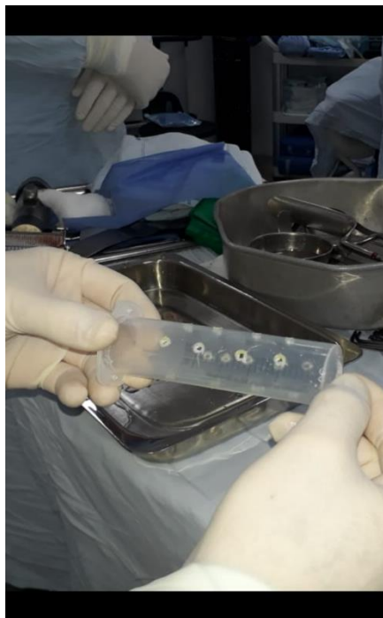
Figura 3: Preparación del molde.