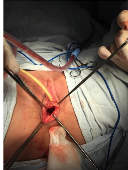
Figura 2: Creación espacio para neovagina.