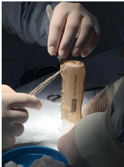
Figura 3a: Preparación del injerto.