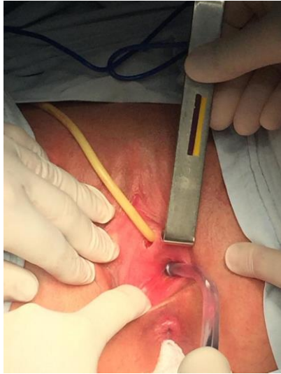
Figura 1: Apariencia vaginal previa a la cirugía.