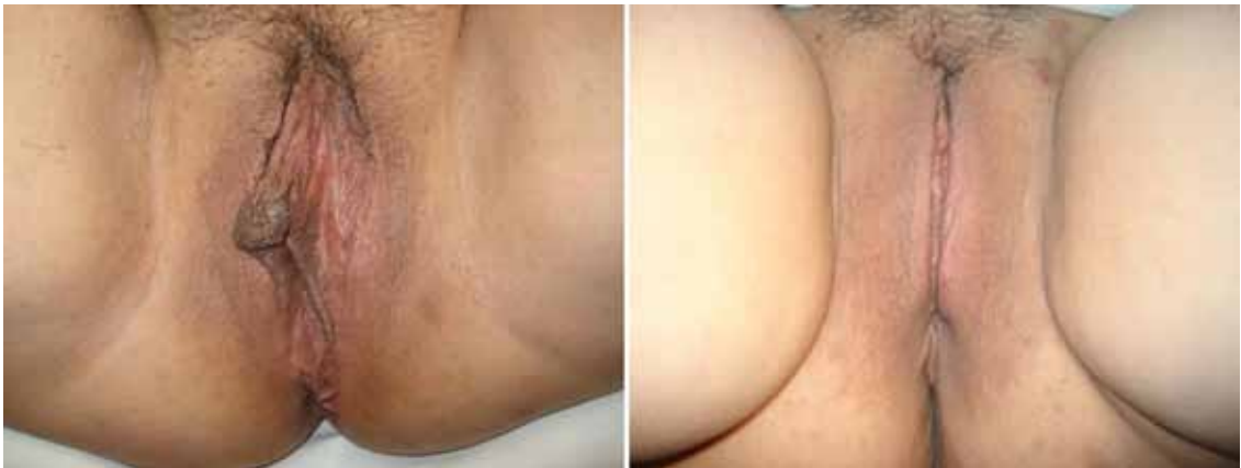
Figura 2. 61 años, labioplastia láser: A antes, B después.