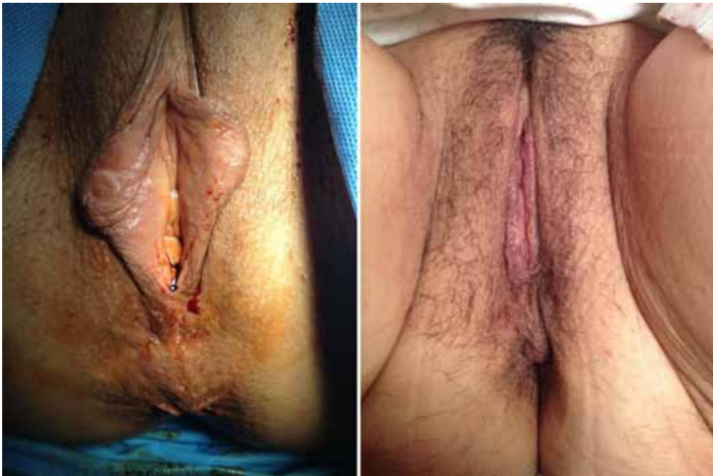
Figura 3. 25 años, labioplastia con electrobisturí: A antes y B después.